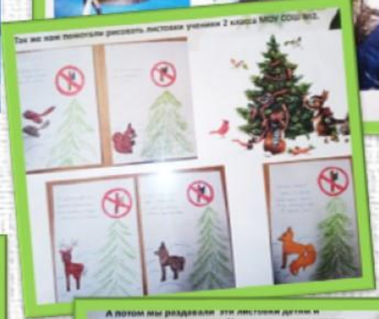
Так же вам помогали рисовать листовки ученики 2 класса МОУ СОШ №12.